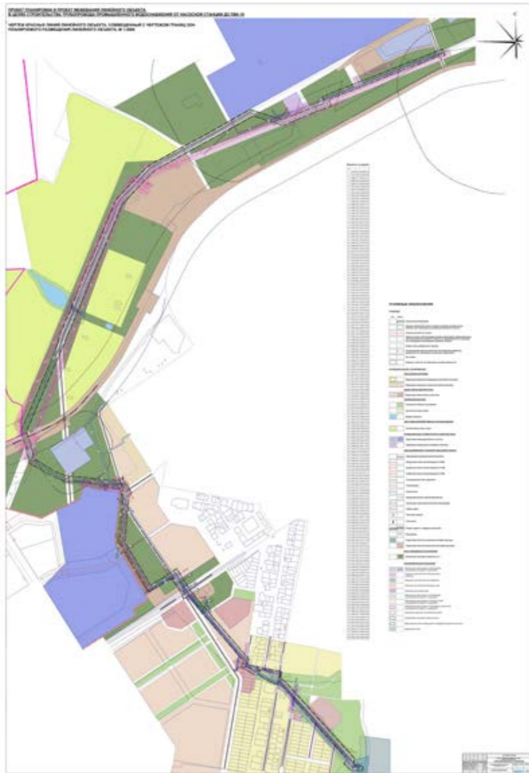
Карты в высоком разрешении размещены на официальном сайте Верхнесалдинского городского округа http://www.v-salda.ru